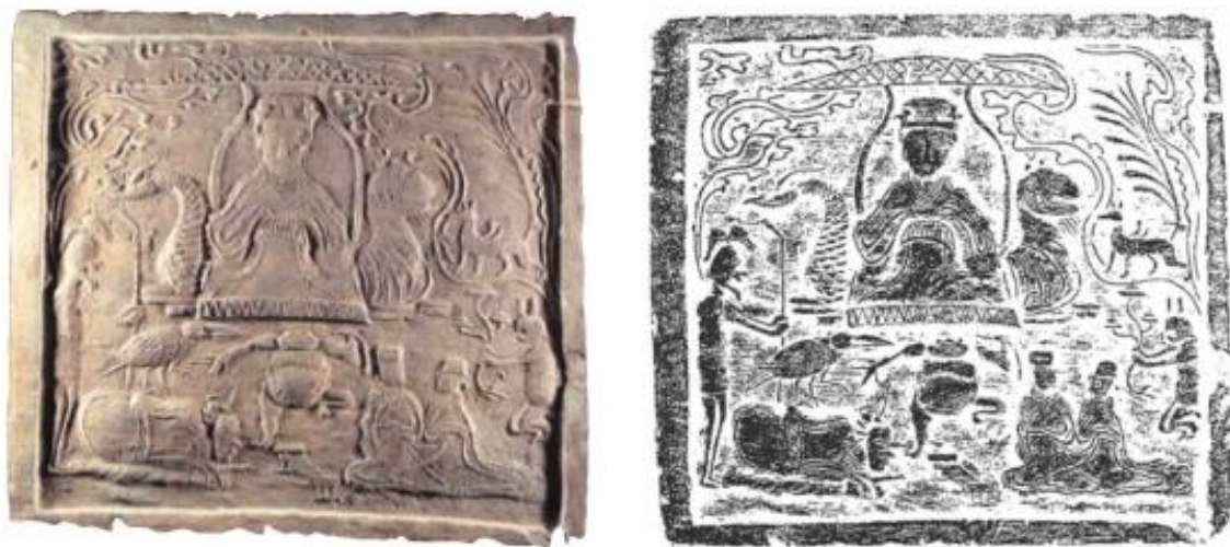
图1 四川成都出土东汉西王母画像砖

在远古神话中，西王母仅是一位具有图腾色彩的神话人物。《山海经》中，她掌管天之灾厉与五刑残杀；《穆天子传》中，她自称“帝女”。至汉代，随着西王母崇拜的日益高涨，她的地位发生了根本性提升。考古材料为此提供了有力证据。我国最早的西王母画像见于西汉昭、宣时期（公元前86年—前49年）的洛阳卜千秋墓彩绘壁画。江苏沛县栖山西汉晚期一号墓中，一具石椁上刻画有诸神朝拜西王母的图像。四川新繁县清白乡汉墓中，西王母的画像砖镶在西侧室前壁正中上方，两旁镶嵌两块画像砖表现日神和月神，胁侍辅佐王母。据巫鸿研究：“四川地区所出的东汉墓葬中及石棺上亦常有伏羲女娲像，有时与日月结合形成复合性的阴阳象征。但不论是在墓中还是在石棺上，西王母总是独自出现，正面端坐于龙虎座上，从不与其他神祇配对。”从这些墓葬中所出土的早期西王母画像上可以看出，西王母是超越阴阳的最高神，呈现为无配偶的独尊形象。