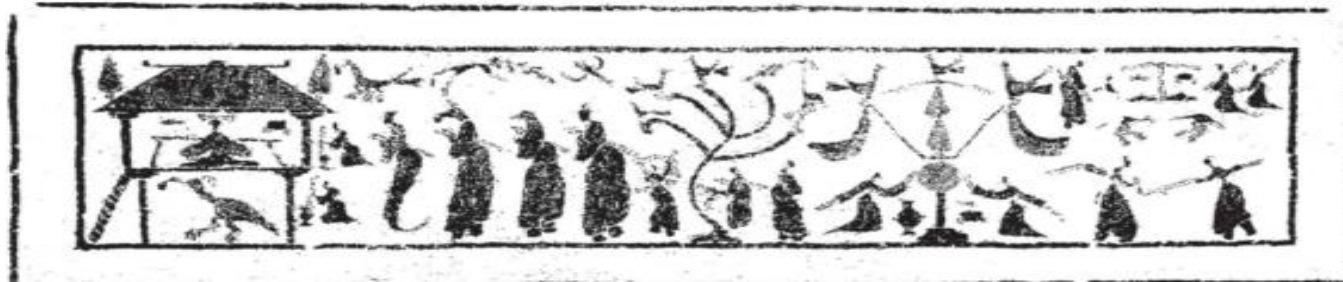
图2 江苏徐州沛县栖山2号汉墓石椁西王母画像

然而，受到汉代强烈的阴阳对立思维模式影响，西王母需要有另一位能够与之相对应的形象出现。在山东孝堂山郭氏墓石祠中，西山墙、东山墙画像显示：“在东汉中期以前的早期祠堂中，由于与女性主仙西王母相对应