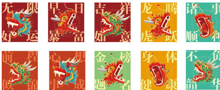
图 12 炮龙节系列小卡

在炮龙节的系列延展设计中，设计者开发了一套文化小卡。该设计以寓意吉祥的祝福成语作为核心文本元素，采用环绕式排版，使文字光芒从视觉中心向四周发散。小卡中央以威严的龙头作为绝对主体，周围辅以简洁现代的几何线条来装饰衬托。这种设计既强化了视觉的集中性与现代感，又通过“图与文”的有机结合，将炮龙节蕴含的攘灾祈福、吉祥瑞纳的民俗寓意转化为易于传播且直观的视觉礼物，向民众传递来自炮龙之乡的美好生活祝愿（图 12）。