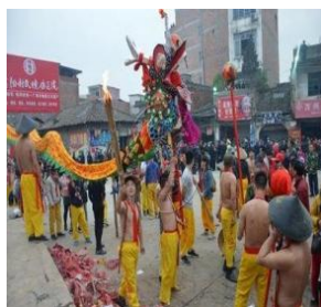
图 7 龙舞