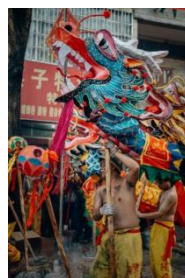
图 9 龙纹样