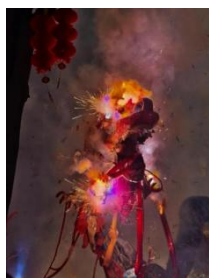
图 8 鞭炮炸龙