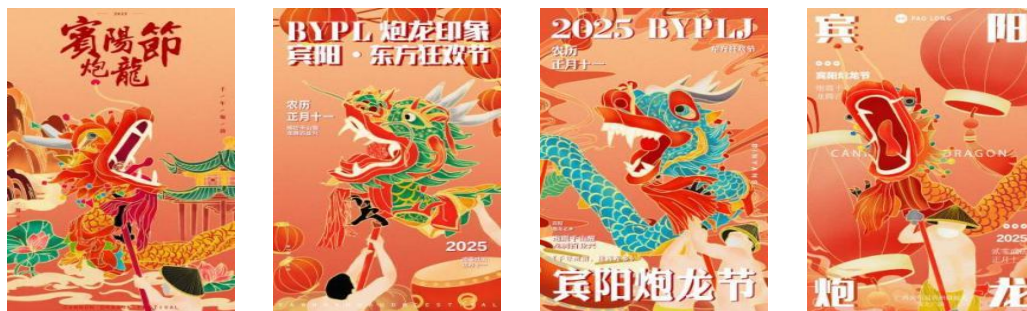
图 11 炮龙节系列插画海报设计

深厚底蕴与鲜活生命力。通过“千年炮韵，独舞龙乡”这幅作品，希望能让观者直观感受到炮龙节的视觉震撼，了解和喜爱炮龙节这一传承千年的文化瑰宝，感受炮龙之乡的独一无二的文化风情。