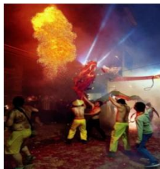
图5 舞龙者(龙脚) 着装