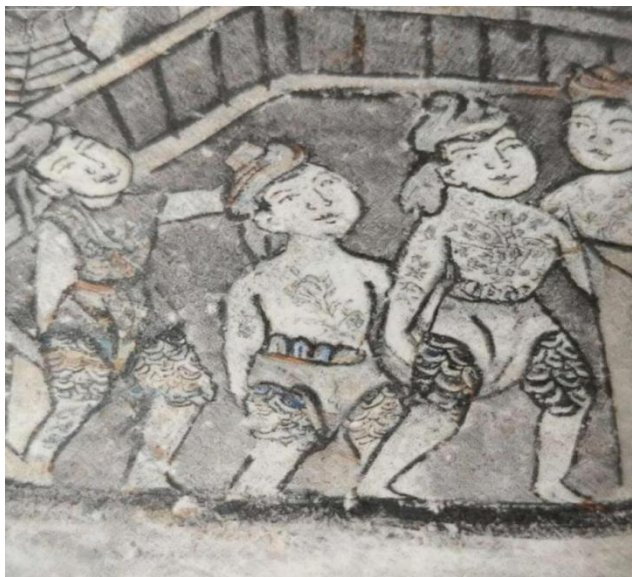
图 3: 傣族腿部文身

壁画文身的设色以黑、蓝为主,部分采用朱色与赭色,与民间文身的视觉效果高度一致,体现了艺术创作与生活实践的关联性。画师采用写实手法,线条轻盈明快、图案生动传神,使文身形象具有强烈的视觉感染力。这些壁画不仅是艺术作品,更是宗教教义的可视化载体,通过直观的文身形象传递善有善报、虔诚信佛的宗教理念,为自幼入寺的僧人提供了持续的文化熏陶,也成为傣族民众接受文身习俗的重要文化诱因 [16] 。