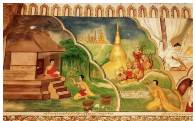
图 2: 傣族南传佛教

原景洪曼洒佛寺的布画《佛祖叭召古塔玛遇难始末》与《生死图》是文身形象的典型载体 [13] :前者描绘的礼佛、迎佛人群袒臂露腿,以多样姿态展示文身纹饰,其中倚“纪勒叫”(双龙天梯)、“帕萨”(木塔)盘坐于“西里该”(经床)者,双臂满布花纹,与佛爷讲经时的形象高度契合 [14] ;后者以善恶因果为主题,描绘善者升天、恶者下地狱的场景,其中多位“善者”绘有文身,曾作为侧壁壁画悬挂于佛殿 [15] 。此外,孟连中缅寺的送丧队列图、勐遮佛寺的节日宴饮图、瑞丽姐东佛寺的驱象对舞图等作品中,舞蹈者身体醒目位置均绘有别致花纹,部分佛像肢体(如景洪曼宰佛寺菩萨手腕)也加饰蚯蚓窝纹、波浪纹等文身样式。