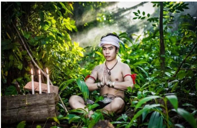
图 1: 傣族文身师

傣族文身的起源与生存环境密切相关,最初承载着“纹身断发,以避蛟龙害”的实用功能,后因蕴含傣民族对生命的敬畏与“爱”的情感内核,在实用价值消退后仍得以传承,并逐渐发展为审美装饰的重要形式 [5] 。傣族将驯良的大象与优雅的孔雀视为吉祥美的象征,融入文身图案中:大象表征驯良、神圣的理想男性美,关联着创世神话、图腾传说及农业保护神信仰;孔雀则象征温婉优雅的女性美,《召树屯》等民间故事便是这一文化内涵的生动体现,反映了傣族对和谐、美与爱的精神追求 [6] 。